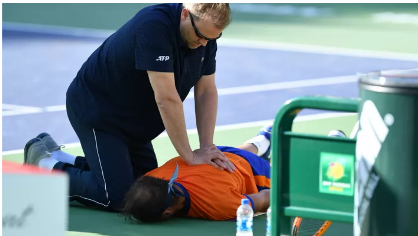
Rafael Nadal.

Rafael Nadal, souffrant, a perdu 6-3, 7-6 (7/5) en finale d'Indian Wells contre Taylor Fritz. Sa première défaite en 2022.